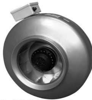
Radiale Rohrventilatoren für Kanaleinbau VENT 100 bis 315 - ab 52,00 €