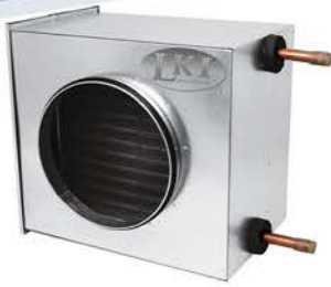
Heizregister LKI 100 bis 500 - ab 149,00 €